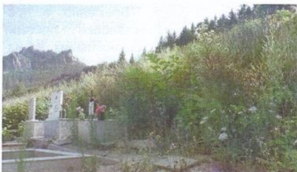
Обраслото с над метър растителност гробище

„Всичко е в трева“, „въобще не се поддър- жа“, „ври от змии“,