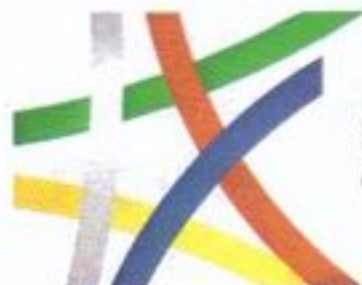
ПРОГРАМА ЗА РАЗВИТИЕ НА СЕЛСКИТЕ РАЙОНИ